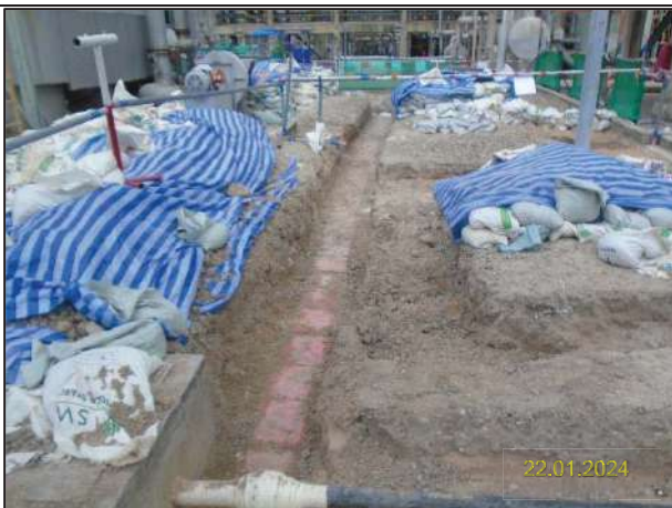
ง) กิจกรรมการติดตั้งหอแยกก๊าซโพรเพน (New DePropanizer Column) และระบบหล่อเย็นแบบ Air Cool