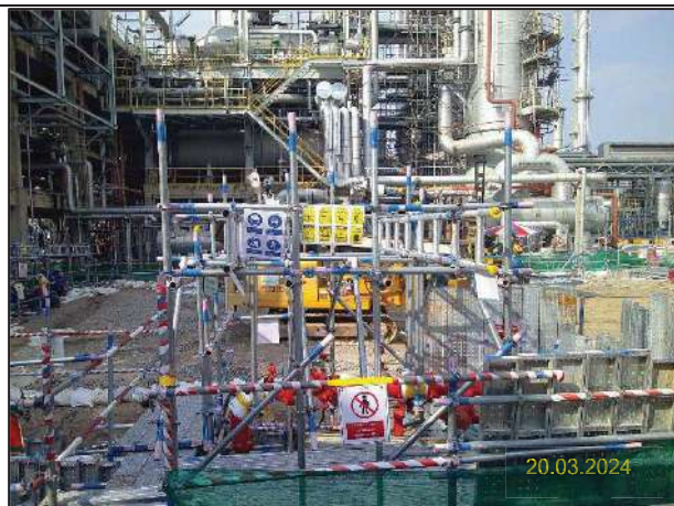
ง) กิจกรรมการติดตั้งหอแยกก๊าซโพรเพน (New DePropanizer Column) และระบบหล่อเย็นแบบ Air Cool รูปที่ 1-7 ตัวอย่างการดำเนินงานของโครงการประจำเดือนมีนาคม พ.ศ. 2567