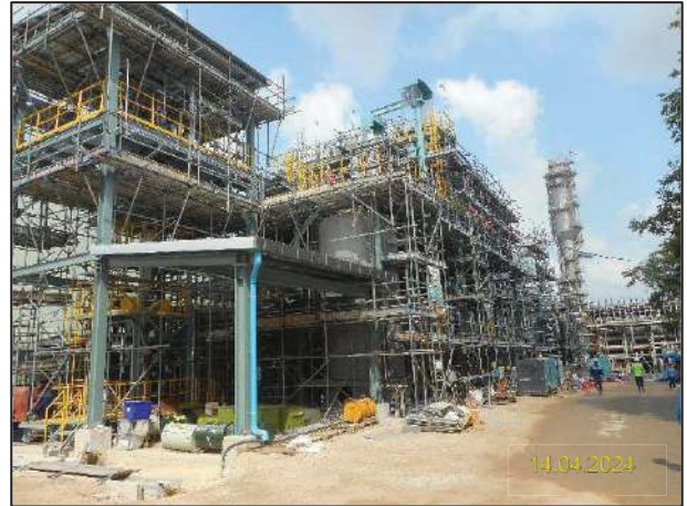
ข) กิจกรรมการติดตั้งระบบระเหยน้ำทิ้ง (Zero Liquid Discharge; ZLD)