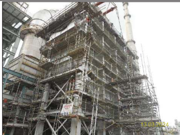
ค) กิจกรรมการติดตั้งหน่วยหมุนเวียนพลังความร้อนเหลือทิ้งกลับคืน (Waste Heat Recovery Unit: WHRU)