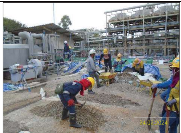
รูปที่ 1-6 ตัวอย่างการดำเนินงานของโครงการประจำเดือนกุมภาพันธ์ พ.ศ. 2567