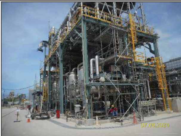
ข) กิจกรรมการติดตั้งหน่วยกำจัดกลิ่นแบบอาร์ทีโอ (Regenerative Thermal Oxidizer; RTO) และ SO 2 Scrubber