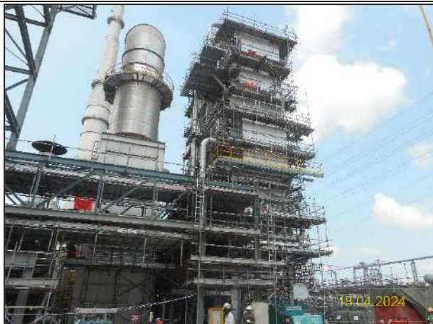
ค) กิจกรรมการติดตั้งหน่วยหมุนเวียนพลังความร้อนเหลือทิ้งกลับคืน (Waste Heat Recovery Unit: WHRU)