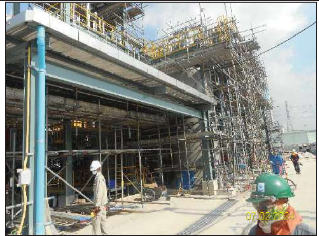
ข) กิจกรรมการติดตั้งระบบประหย่าน้ำทิ้ง (Zero Liquid Discharge; ZLD)