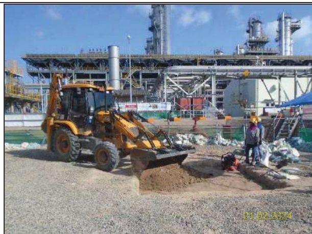
ง) กิจกรรมการติดตั้งหอแยกก๊าซโพรเพน (New DePropanizer Column) และระบบหล่อเย็นแบบ Air Cool