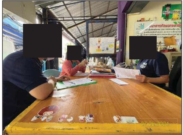
ก) กิจกรรมการประชาสัมพันธ์โครงการก่อนเริ่มการก่อสร้างงานติดตั้งหน่วยบำบัดน้ำทิ้งด้วยโอโซน (Advanced Oxidation Process; AOPs)