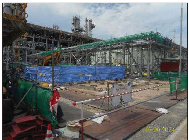
จ) กิจกรรมการติดตั้งหอแยกก๊าซโพรเพน (New DePropanizer Column) และระบบหล่อเย็นแบบ Air Cool

รูปที่ 1-10 ตัวอย่างการดำเนินงานของโครงการประจำเดือนมิถุนายน พ.ศ. 2567