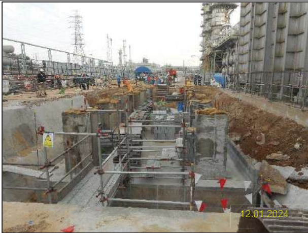
ค) กิจกรรมการติดตั้งหน่วยหมุนเวียนพลังความร้อนเหลือทิ้งกลับคืน (Waste Heat Recovery Unit: WHRU)