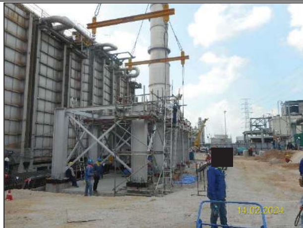
ค) กิจกรรมการติดตั้งหน่วยหมุนเวียนพลังความร้อนเหลือทิ้งกลับคืน (Waste Heat Recovery Unit: WHRU)