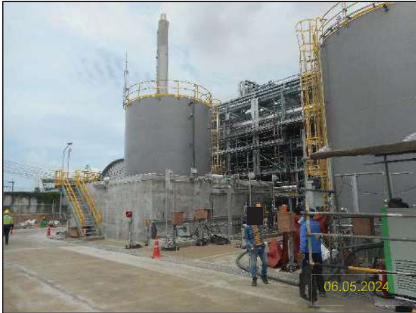
ก) กิจกรรมการติดตั้งหน่วยกำจัดกลิ่นแบบอาร์ทีโอ (Regenerative Thermal Oxidizer; RTO) และ SO 2 Scrubber

รายงานผลการปฏิบัติตามมาตรการป้องกันและแก้ไขผลกระทบสิ่งแวดล้อม และมาตรการติดตามตรวจสอบผลกระทบสิ่งแวดล้อม (ระยะก่อสร้าง) โครงการภายในพื้นที่โรงแยกก๊าซธรรมชาติระยอง (ภายหลังการเปลี่ยนแปลงรายละเอียดโครงการในรายงานการประเมินผลกระทบสิ่งแวดล้อม โครงการภายในพื้นที่โรงแยกก๊าซธรรมชาติระยอง (ครั้งที่ 5)) ฉบับที่ 5 ระหว่างเดือนมกราคมถึงเดือนมิถุนายน พ.ศ. 2567