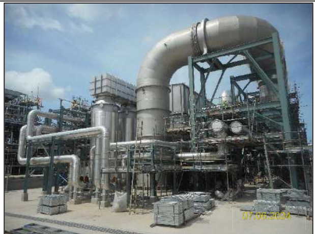
ค) กิจกรรมการติดตั้งระบบระเหยน้ำทิ้ง (Zero Liquid Discharge; ZLD)