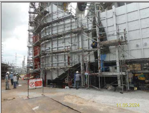
ค) กิจกรรมการติดตั้งหน่วยหมุนเวียนพลังความร้อนเหลือทิ้งกลับคืน (Waste Heat Recovery Unit: WHRU)