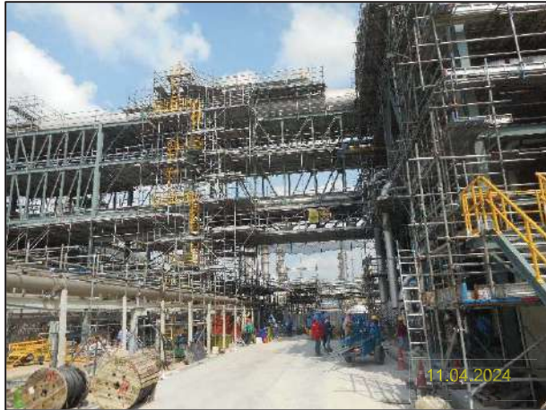
ก) กิจกรรมการติดตั้งหน่วยกำจัดกลิ่นแบบอาร์ทีโอ (Regenerative Thermal Oxidizer; RTO) และ SO 2 Scrubber