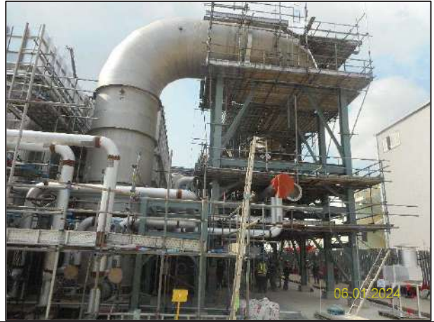
ข) กิจกรรมการติดตั้งระบบประเหียนน้ำทิ้ง (Zero Liquid Discharge; ZLD)