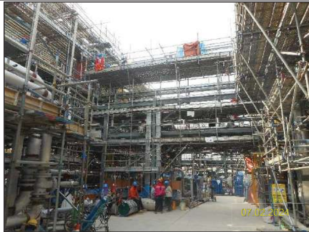
ก) กิจกรรมการติดตั้งหน่วยกำจัดกลิ่นแบบอาร์ทีโอ (Regenerative Thermal Oxidizer; RTO) และ SO 2 Scrubber