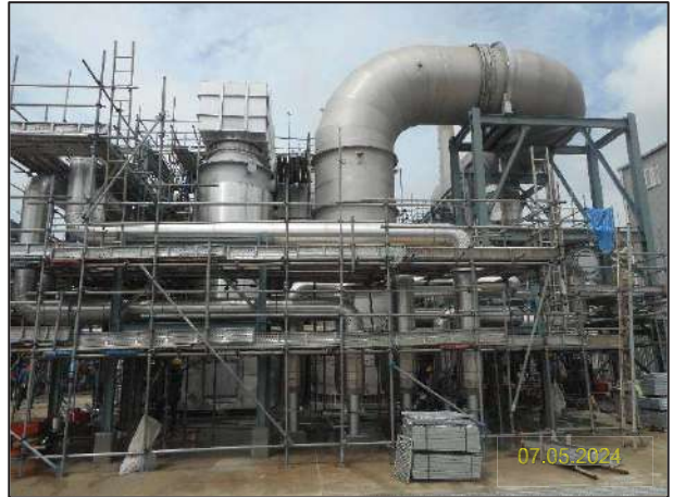
ข) กิจกรรมการติดตั้งระบบระเหยน้ำทิ้ง (Zero Liquid Discharge; ZLD)