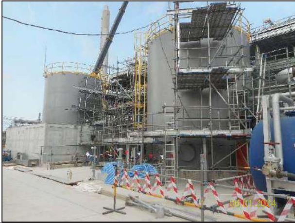
ก) กิจกรรมการติดตั้งหน่วยกำจัดกลิ่นแบบอาร์ทีโอ (Regenerative Thermal Oxidizer; RTO) และ SO 2 Scrubber