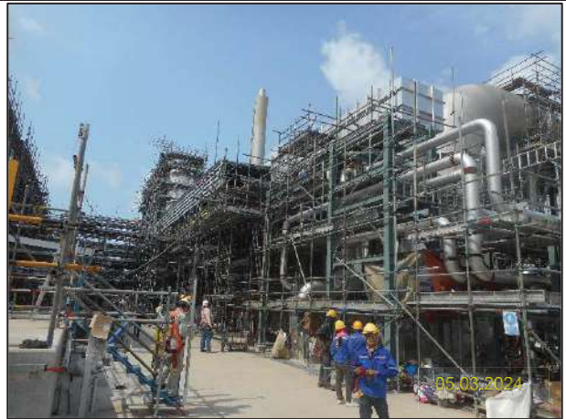
ข) กิจกรรมการติดตั้งระบบประเหยน้ำทิ้ง (Zero Liquid Discharge; ZLD)