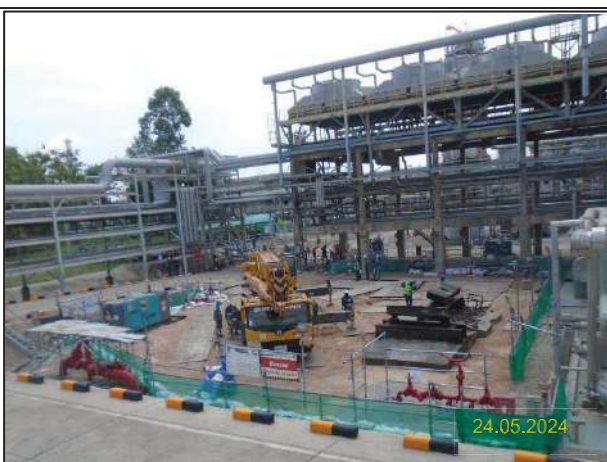
ง) กิจกรรมการติดตั้งหอแยกก๊าซโพรเพน (New DePropanizer Column) และระบบหล่อเย็นแบบ Air Cool