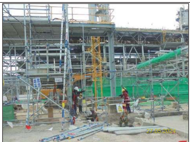
จ) กิจกรรมการติดตั้งหอแยกก๊าซโพรเพน (New DePropanizer Column) และระบบหล่อเย็นแบบ Air Cool

รูปที่ 1-9 ตัวอย่างการดำเนินงานของโครงการประจำเดือนพฤษภาคม พ.ศ. 2567