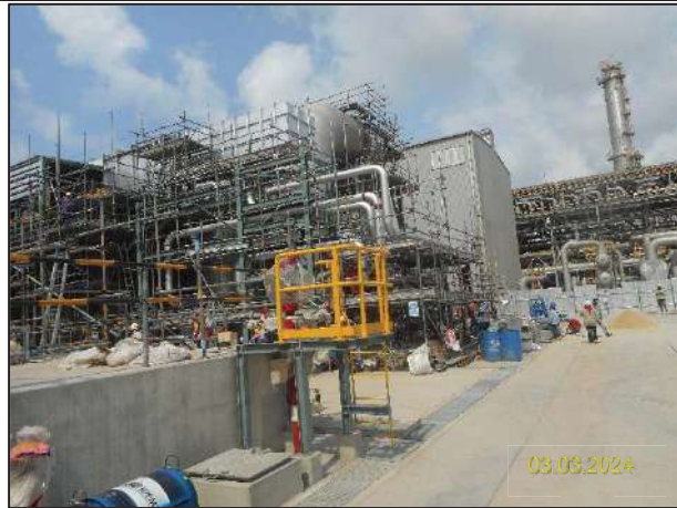
ก) กิจกรรมการติดตั้งหน่วยกำจัดกลิ่นแบบอาร์ทีโอ (Regenerative Thermal Oxidizer; RTO) และ SO 2 Scrubber