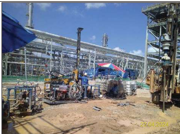
ง) กิจกรรมการติดตั้งหอแยกก๊าซโพรเพน (New DePropanizer Column) และระบบหล่อเย็นแบบ Air Cool