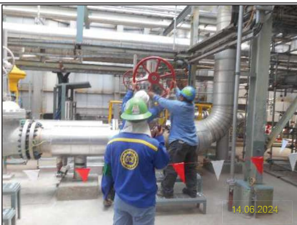
ง) กิจกรรมการติดตั้งหน่วยหมุนเวียนพลังงานความร้อนเหลือ ทิ้งกลับคืน (Waste Heat Recovery Unit: WHRU) (งานทดสอบระบบ)